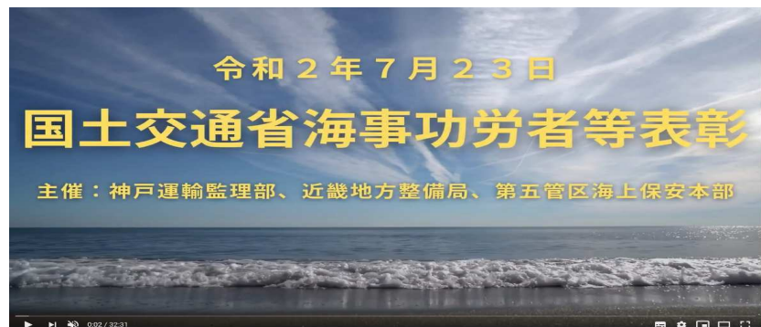
【チャンネル名：「海の日」海事功労者等表彰 in KOBE】