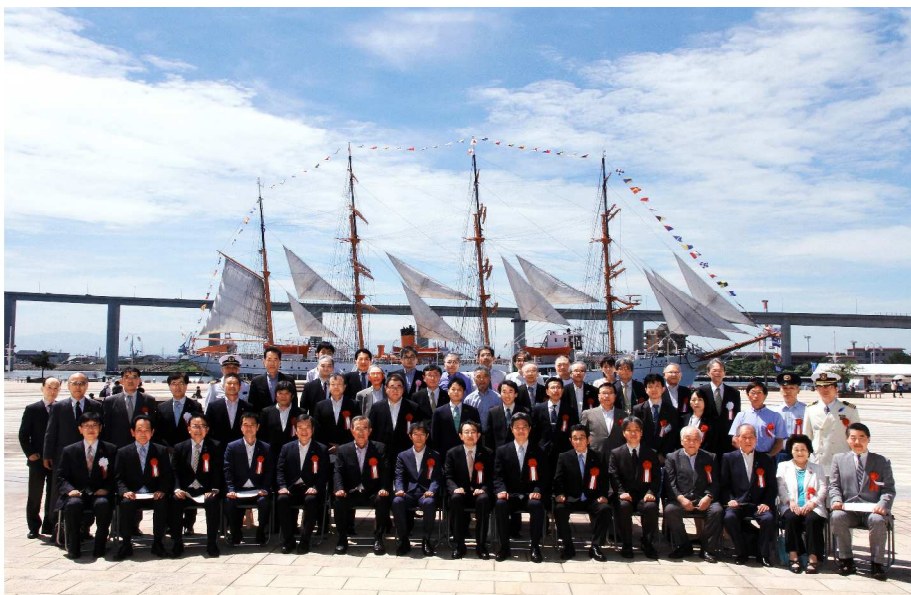
帆船海王丸一般公開30周年記念式典 令和2年 8月10日