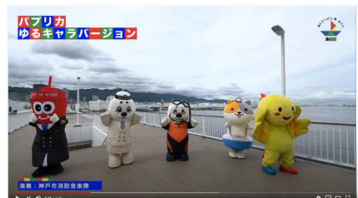
【チャンネル名：海の日チャンネル・KOBE】