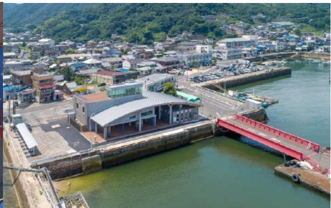
みたかゲートハウス