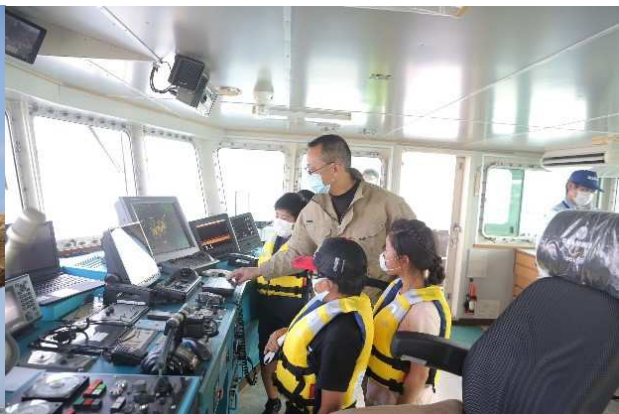
海面浮遊ごみ回収の実演や船の構造に興味津々！

*****： 本メールマガジンに関するお問合せやご意見、また情報の送り先 ***** 日本港湾振興団体連合会事務局 〒105-0002 港区愛宕1-3-4 TEL:03-5776-0630 FAX:03-5776-0631 e-mail: bcf06323@nifty.com